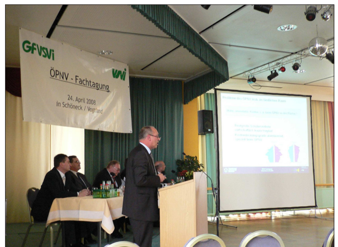
Abb. 3 Tagungsraum