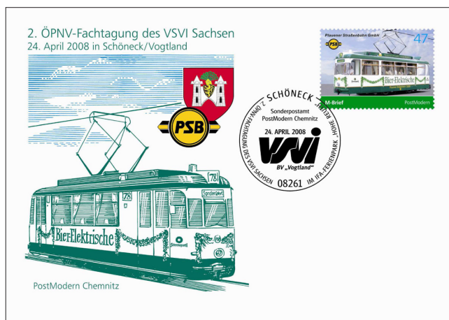
Abb. 4 Sonderbriefumschlag anlässlich der ÖPNV-Fachtagung

Zur Erinnerung wurde gemeinsam durch VSVI und den privaten Postdienstleister PostModern WVD Postservice Partner Chemnitz GmbH ein Ersttagsbrief (FDC) mit einer Sonderbriefmarke und einem Sonderstempel herausgegeben. Auf dem FDC ist die historische Straßenbahn „Bier-Elektrische“, das Stadtwappen von Plauen (Vogtl.) und das Logo der Plauerer Straßenbahn GmbH (PSB) abgebildet. Der Stempel zeigt das Logo der VSVI. Die Umschläge und die Briefmarke stießen bei den Teilnehmern auf großes Interesse.